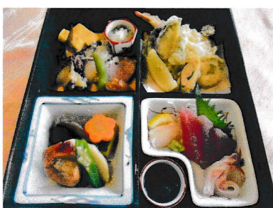
松花堂 A 3,000円(税込み)