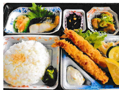
お弁当 C 1,500円(税込み)