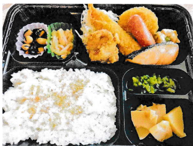
お弁当 A 850円(税込み)