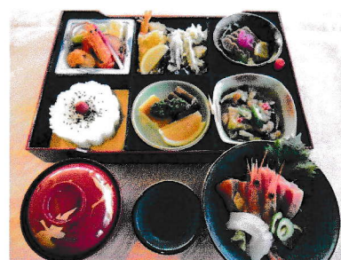
松花堂 B 5,000円(税込み)