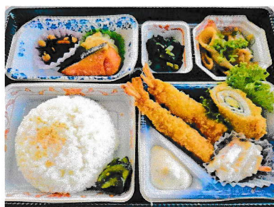
お弁当 B 1,000円(税込み)