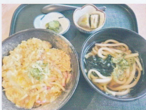
ランチ 玉子丼セット