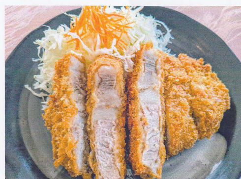
ランチ 厚切りとんかつ定食 [200g]