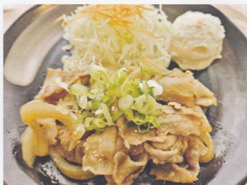
ランチ しょうが焼き定食