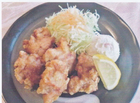
ランチ からあげ定食