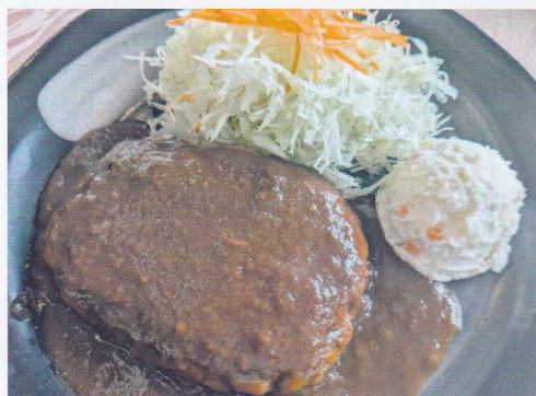
ランチ ハンバーグ定食 [130g]